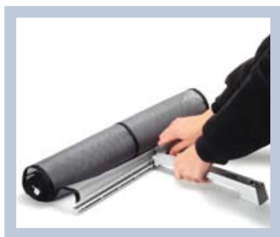
Para desmontarlo, basta con retirar la barra de soporte y el pie, y enrollar los compartimientos para folletos.