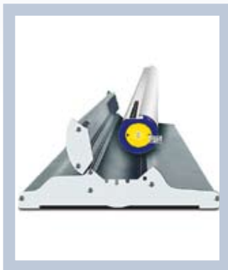
L'illustration est bien protégée pendant le transport.

Roll Up Classic a été récompensé par le jury de l'association Svensk Form qui lui a décerné le prix « Art utilitaire »! Ce système est facile à transporter et à mettre en place pour une présentation. Roll Up Classic se décline en plusieurs largeurs et peut être réutilisé dans des environnements divers.