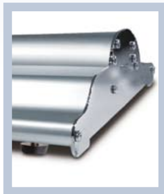
Une conception stable avec des pieds compensant l'inégalité du support.